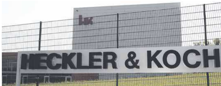
„Dringender Tatverdacht gegen zwei Mitarbeiter“: HK in Oberndorf.

Kreis Rottweil (him). Zwei Mitarbeiter aus der mittleren Ebene hat der Oberndorfer Waffenhersteller Heckler und Koch fristlos entlassen. Sie sollen die Schuldigen für den illegalen Waffenverkauf von G-36-Gewehren in vier mexikanische Unruheprovinzen sein (die NRWZ berichtete).